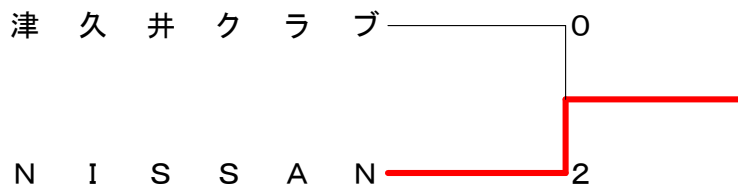
男子団体1部 決勝トーナメント